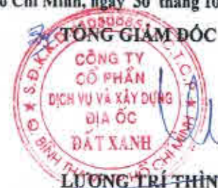
LƯƠNG TRÍ THÌN